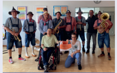
Checkübergabe an das Blumenhaus

Das Blumenhaus darf immer wieder auf die tatkräftige Unterstützung zahlreicher Firmen und Privatpersonen zählen und erhält zudem regelmässig wertvolle Spenden. An dieser Stelle möchten wir allen ein herzliches Dankeschön aussprechen, die sich mit uns verbunden fühlen und uns auf unterschiedlichste Weise unterstützen – sei es durch Zeit, finanzielle Beiträge oder kreative Ideen, die unseren Alltag bereichern.